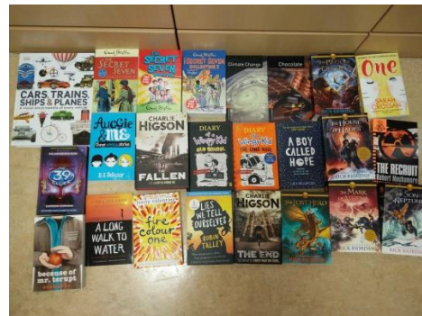
Livres pour la bibliothèque S1-S3