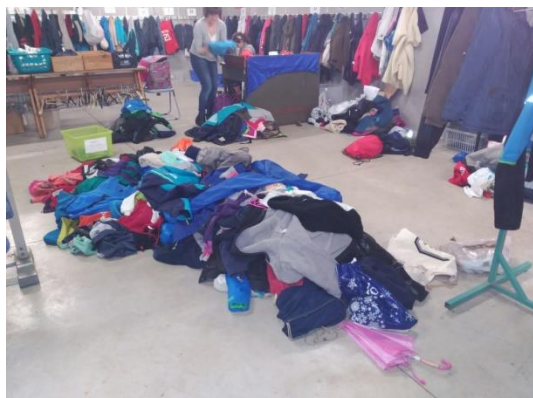
Dernier ramassage avant l'été