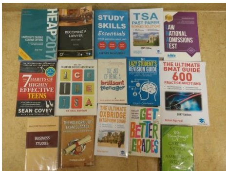
Livres pour la bibliothèque S4-S7