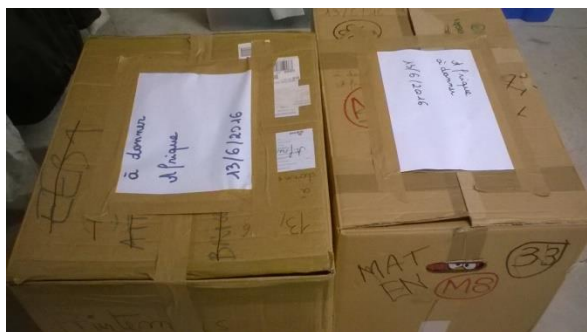
Caisses destinées aux dons

Pour l'année scolaire qui commence, nous voudrions continuer à collaborer avec la nouvelle direction de primaire et secondaire de l'école. Avec la réouverture du bâtiment Fabiola, il va falloir aider les plus petits de l'école. Il va falloir aussi continuer à faire mieux connaître le service aux secondaires et les aider à collaborer avec nous, comme ils le font déjà de par les projets comme « Serve the City » en juillet, et de la Zambie en septembre, projets pour lesquels ils sont impliqués.