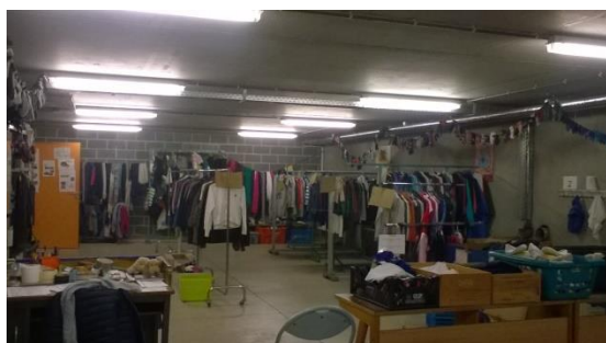
Le local d'Eurêka