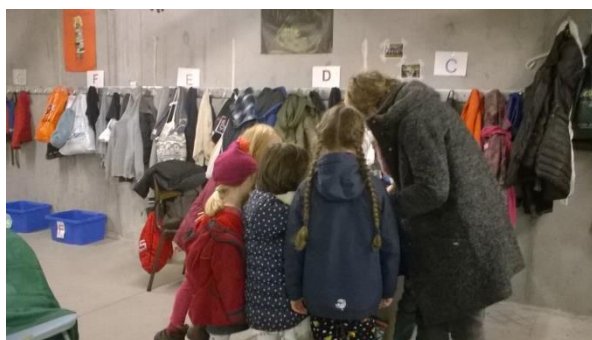
Qui cherche trouve... ou pas...